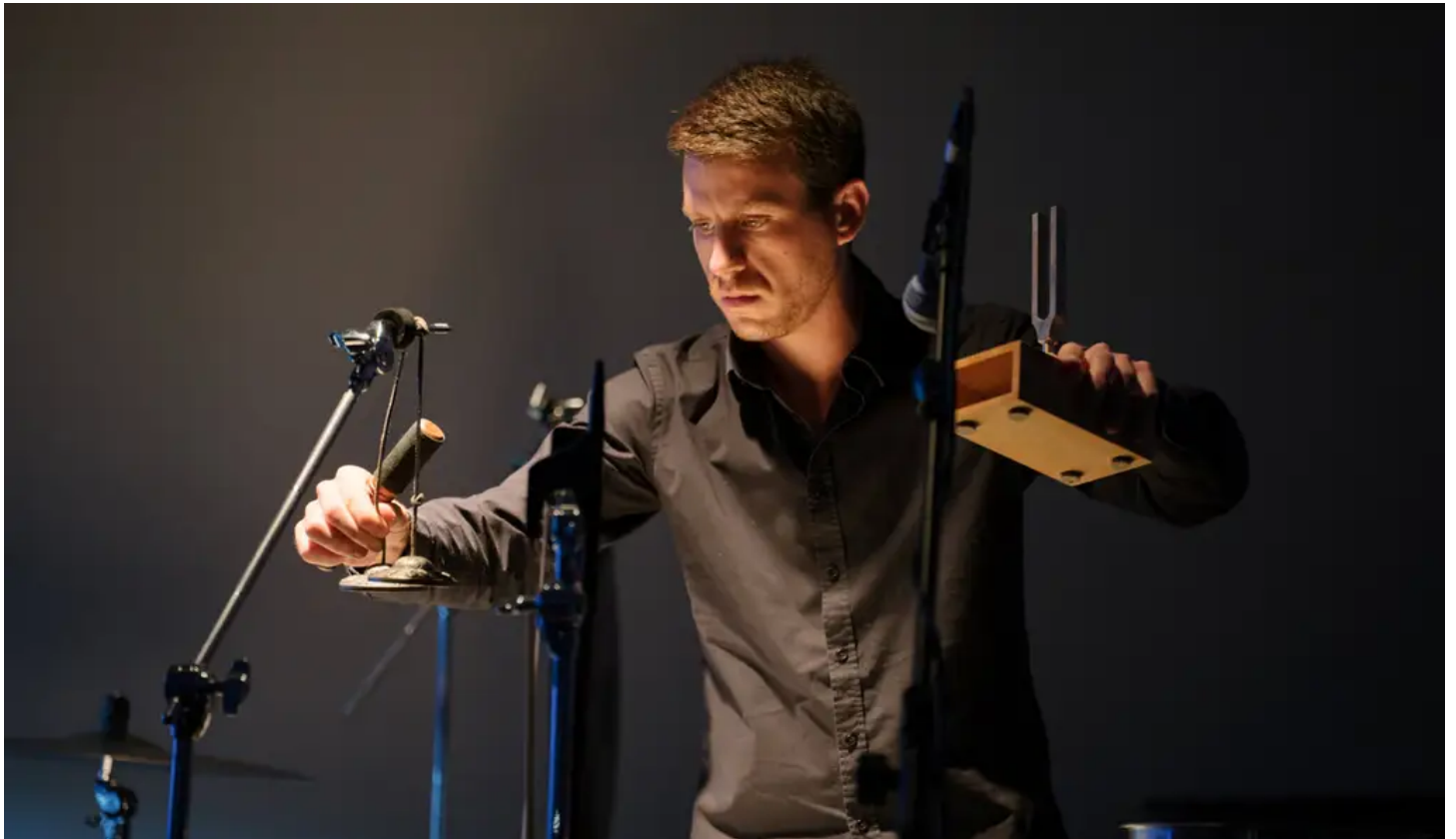
"שחרור באמצעות שמיעה". תנועה חזרתית